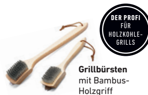
Grillbürsten mit Bambus-Holzgriff