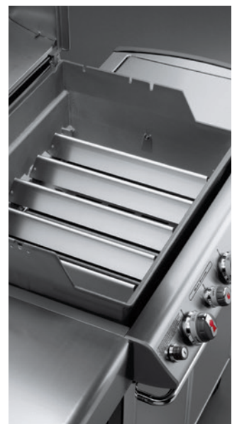
Flavorizer Bars Aromaschienen

Insbesondere Grillroste und Flavorizer Bars Aromaschienen sind hohen thermischen Belastungen ausgesetzt. Fett und andere herabtropfende Flüssigkeiten brennen sich bei hohen Temperaturen in emaillierte oder auch Edelstahlflächen ein. Oberflächige Korrosion entsteht durch unmittelbare Hitzeeinwirkung und ist kein Qualitätsmangel. Es handelt sich hierbei um normale Gebrauchsspuren.