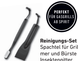
Reinigungs-Set mit Spatel für Grillkammer und Bürste für Insektengitter