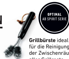
Grillbürste ideal für die Reinigung der Zwischenräume aller Grillroste