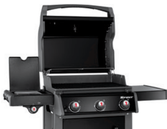
Spirit E-320 Original mit geöffnetem Deckel

Auf der Innenseite des Deckels haftet mit der Zeit Fettdunst an. Dieser lässt sich an dem noch warmen Deckel am leichtesten mit dem Weber Grillreiniger, heißem Wasser und einem rauen Küchenschwamm reinigen. Bei Ihrem Grill blättert Farbe an der Innenseite des Deckels ab? Die Weber Gasgrills der Serien Spirit, Genesis und Summit sind emailliert oder aus Edelstahl. Es ist keine Farbe oder eine andere Beschichtung aufgetragen. Was jedoch abblättern kann, sind anhaftende Fettreste, die mit der Zeit verbrennen (karbonisiertes Fett). Diese Reste können Sie jedoch wieder durch Einweichen und Reinigen mit fettlösenden Mitteln und heißem Wasser entfernen.