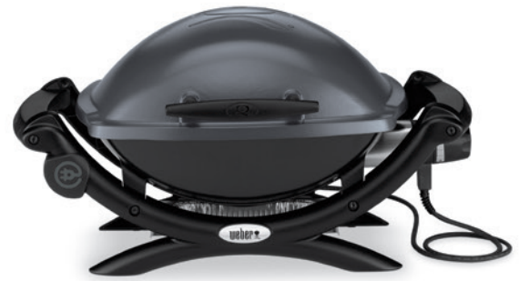
Weber Q 1400, Dark Grey

Bitte hierzu unbedingt die dem Grill beiliegende Bedienungsanleitung beachten! Grobe Verschmutzungen können Sie einfach mit einem Küchenwender oder einem Spatel aus Holz oder Plastik entfernen.