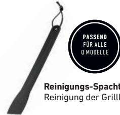
Reinigungs-Spatel zur Reinigung der Grillkammer