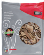
Fire Spice Chips