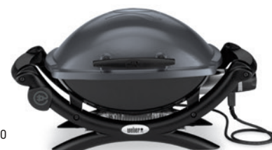
Weber Q 1400

Stellen Sie den Grill in einem windgeschützten Bereich auf. Ansonsten folgen Sie bitte den Empfehlungen wie für Gas- und Holzkohlegrills beschrieben.