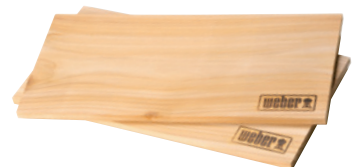
Weber Räucherbretter (Seite 4)