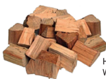
Holzstücke – Wood Chunks

Chunks sind große Holzstücke, zum Teil tennisballgroß und haben den Vorteil, dass diese sehr gleichmäßig über einen längeren Zeitraum Rauch abgeben. Es muss also nicht so oft, wie bei den Räucherchips, nachgelegt werden. Damit sind die Chunks speziell für längere Garzeiten wie z. B. im Smokey Mountain Cooker geeignet.