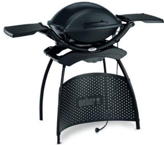
Weber Q 2400 Stand

Bei kurz gegrilltem Fleisch, Fisch oder Gemüse warten Sie, bis sich zunächst der Rauch entwickelt hat. Legen Sie erst danach das Grillgut auf den Grillrost und schließen dann sofort den Deckel. Auf dem Grillrost können Sie Chips oder auch Chunks verwenden.