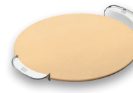
Gourmet BBQ System – Pizzastein mit Gestell