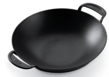
Gourmet BBQ System – Wok Einsatz