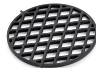
Gourmet BBQ System – Sear Grate Einsatz