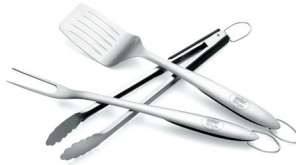
Grillbesteck Weber® Style™ 3-teilig aus Edelstahl