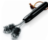
Grillbürste ideal für die Reinigung der Zwischenräume aller Grillroste

Sie können für alle Weber® Grillroste die Weber® Edelstahl Grillrostbürste benutzen. Verwenden Sie in keinem Fall normale Stahlbürsten. Diese sind zu hart und könnten die Oberfläche der Grillroste zerstören.