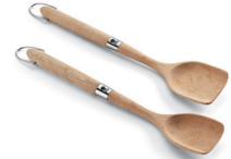
Wokbesteck-Set 2-teilig aus Buchenholz