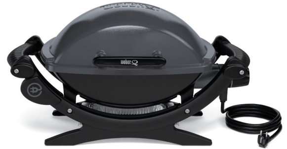
Weber® Q™ 140, Dark Grey

Für eine intensive Reinigung der Innenseite der Grillkammer können Sie das Regelement an der Seite herausziehen und danach zwei Schrauben für die Entnahme des Heizelements lösen. Entfernen Sie die Halteklammer und schon kann die Grillkammer komplett und frei zugänglich gereinigt werden. Bitte hierzu unbedingt die dem Grill beiliegende Bedienungsanleitung beachten! Grobe Verschmutzungen können Sie einfach mit einem Küchenwender oder einem Spatel aus Holz oder Plastik entfernen.