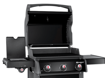
Spirit® E-320 Original mit geöffnetem Deckel

Bei Ihrem Grill blättert Farbe an der Innenseite des Deckels ab? Die Weber® Gasgrills der Serien Spirit®, Genesis® und Summit® sind emailliert oder aus Edelstahl. Es ist keine Farbe oder eine andere Beschichtung aufgetragen. Was jedoch abblättern kann, sind anhaftende Fettreste, die mit der Zeit verbrennen (karbonisiertes Fett). Diese Reste können Sie jedoch wieder durch Einweichen und Reinigen mit fettlösenden Mitteln und heißem Wasser entfernen.