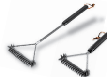
Grillbürsten 3-seitig, für Gas- und Elektrogrills