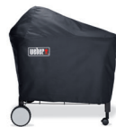
Passende Abdeckhauben für jedes Grillmodell