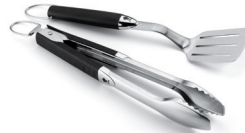
Grillbesteck Kompakt 2-teilig aus Edelstahl