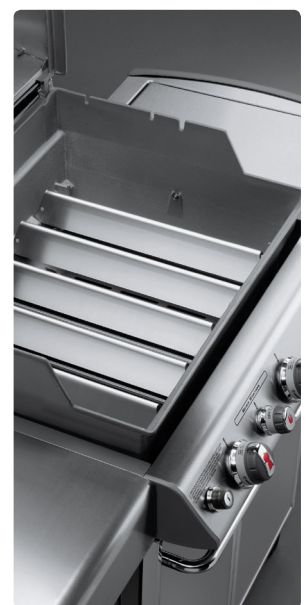
Flavorizer Bars® Aromaschienen

Insbesondere Grillroste und Flavorizer Bars® Aromaschienen sind hohen thermischen Belastungen ausgesetzt. Fett und andere herabtropfende Flüssigkeiten brennen sich bei hohen Temperaturen in emaillierte oder auch Edelstahlflächen ein. Oberflächige Korrosion entsteht durch unmittelbare Hitze einwirkung und ist kein Qualitätsmangel. Es handelt sich hierbei um normale Gebrauchsspuren.