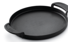
Gourmet BBQ System – Pfannen Einsatz

Vor der ersten Benutzung: Reinigen Sie die gusseisernen Einsätze gründlich mit heißem Wasser, Spülmittel und einem rauen Küchenschwamm. Trocknen Sie die Einsätze gründlich ab. Reinigen Sie nach der Verwendung die Einsätze mit heißem Wasser, Spülmittel und einem rauen Küchenschwamm. Bei hartnäckigen Verkrustungen können Sie die Einsätze auch in warmem Wasser einweichen. Achtung: Verwenden Sie keine Küchenschwämme mit metallischen oder keramischen Scheueranteilen! Das kann die emaillierte Oberfläche der Einsätze zerstören. Trocknen Sie die Einsätze gründlich ab. Nicht in der Spülmaschine reinigen. Bürsten Sie den klappbaren Gourmet BBQ Systemrost mit der Weber® Edelstahlbürste ab (siehe auch Hinweise zur Pflege Holzkohlegrills).