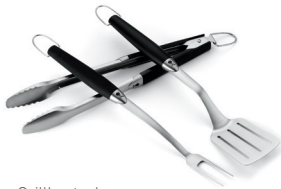
Grillbesteck 3-teilig aus Edelstahl

Generell können Sie alle Weber® Grillbestecke in der Spülmaschine reinigen. Das Weber® Wok Besteck aus Buchenholz bitte ausschließlich mit der Hand spülen.