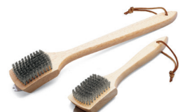
Grillbürsten mit Bambus-Holzgriff, für Holzkohlegrills